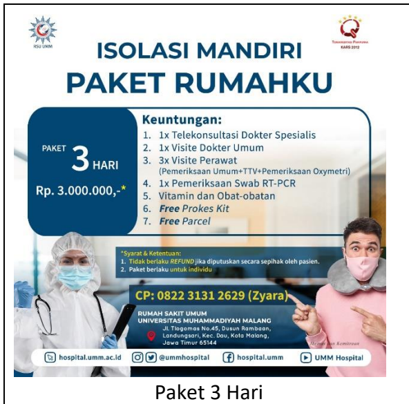
Paket 3 Hari