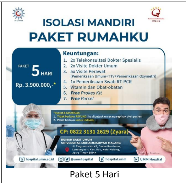
Paket 5 Hari