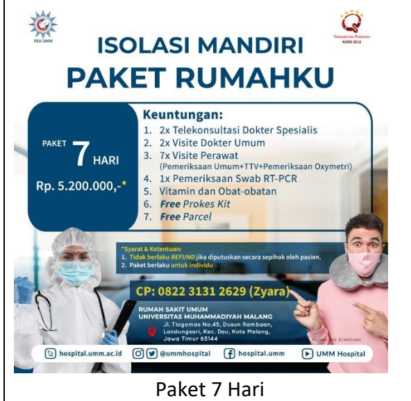
Paket 7 Hari