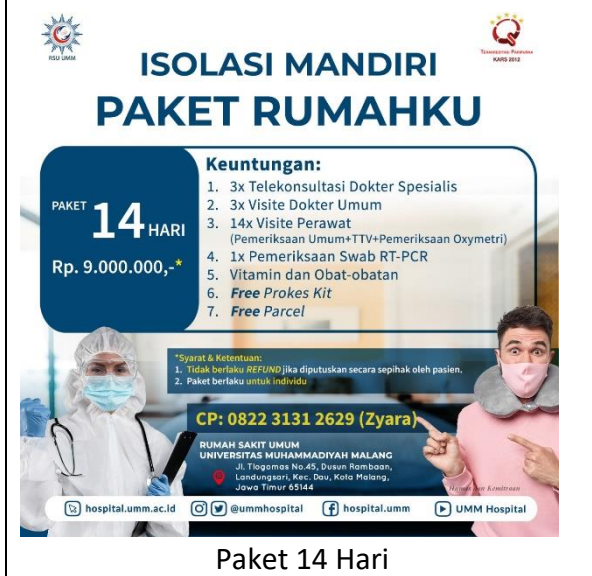
Paket 14 Hari

Syarat & Ketentuan 1. Tidak berlaku refund jika diputuskan secara sepihak oleh pasien 2. Paket berlaku untuk individu CP: 0822 3131 2629 (Zyara)