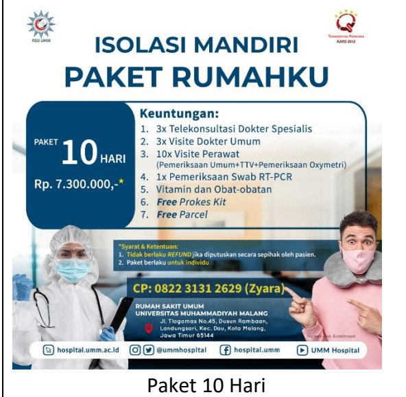
Paket 10 Hari