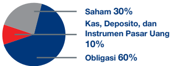
Data Alokasi Aset Strategis RMP (per Desember 2017)