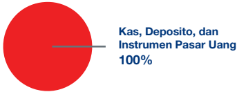
Data Alokasi Aset Strategis RCF (per Desember 2017)