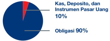
Data Alokasi Aset Strategis RFF (per Desember 2017)