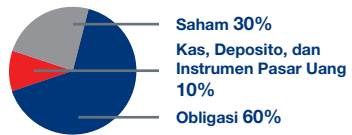
Data Alokasi Aset Strategis RMF (per Desember 2017)